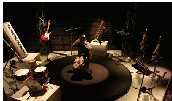
図3 Sound Scope Headphones

パートが大きく聴こえるようになる。さらに耳に手を近づけると、そのとき正面で聴いているパートがさらに強調され、あたかもフォーカスしたかのように聴くことができる。音楽初心者の場合、どの楽器がどのような音色であるかわからない場合が考えられるが、図3は、周囲に楽器を配置し、各楽器の音量に応じて楽器に照明を当てることで楽器とその音色との対応関係がとれるように工夫したものである 1 。